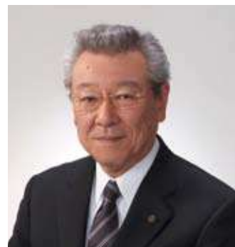
市岡市議会議長様

さて、ふるさと佐世保の近況でございますが、市民の皆さんが生き生きと暮らせ、ひとが輝く街「佐世保」を目指し、市民の皆さんとともに様々な事業に取り組んでいるところでございます。どうか、皆様方におかれましては、関西の地から、ふるさと佐世保に熱いエールを送っていただきますようお願いします。