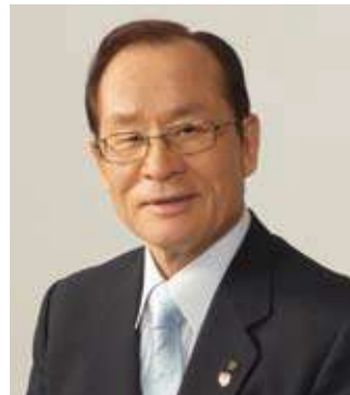
朝長佐世保市長様